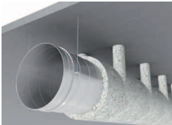
Croquis 1 - Montage des conduits